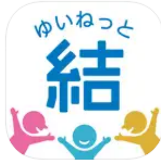
結ネット(ゆいねっと) ソーシャルネットワーキング