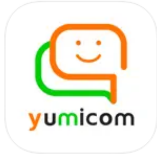
ユミコム ソーシャルネットワーキング