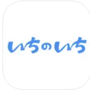
いちのいち-地域密着型の SNS ソーシャルネットワーキング