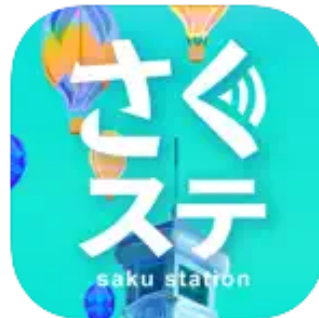
さくステ ソーシャルネットワーキング