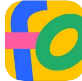
fowald ソーシャルネットワーキング