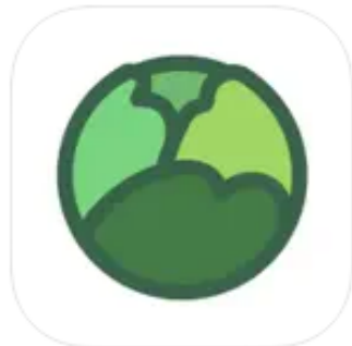
チョコバイGO! ソーシャルネットワーキング