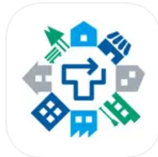
タウン・デジボ ソーシャルネットワーキング